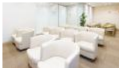
レディースラウンジ