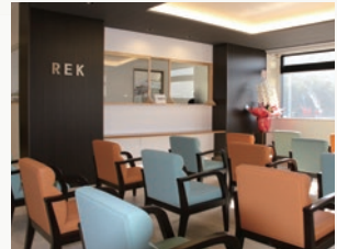
延岡健診センター