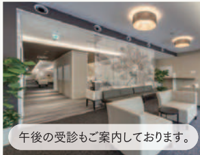
天神健診センター