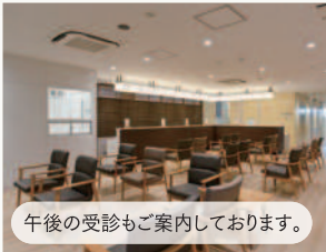
那の川健診センター