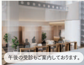
健診スクエア博多