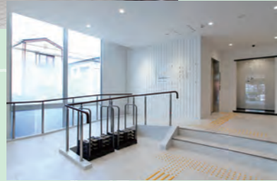
バリアフリーの「エントランスホール」