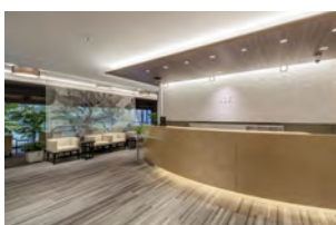
天神健診センター 福岡市中央区天神2-8-36 天神NKビル2F TEL:092-526-1036

公益財団法人 福岡労働衛生研究所は、「労衛研健診センター」の他にも西日本全域をカバーする健康診断の専門施設を展開しています。