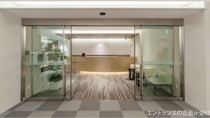
エントランスの正面が受付