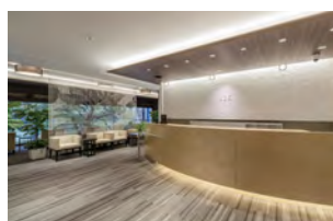
天神健診センター 福岡市中央区天神2-8-36 天神NKビル2F TEL:092-526-1036